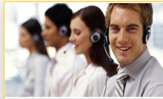
Unsere Kundenberater unterstützen Sie gerne bei Ihren E-Mailings