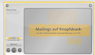
Unter www.gtc.de/demoemail sehen Sie, wie einfach das geht!