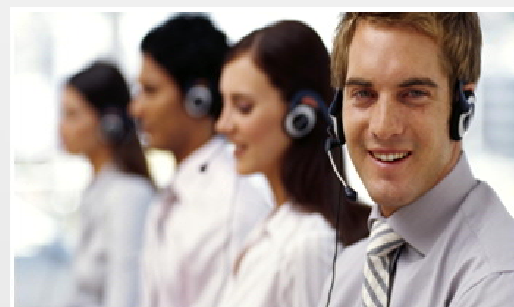
Individuelle Betreuung durch unsere qualifizierten Kundenberater